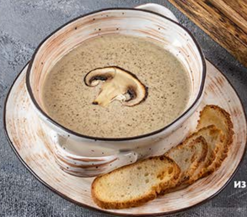
Крем – Суп из шампиньонов