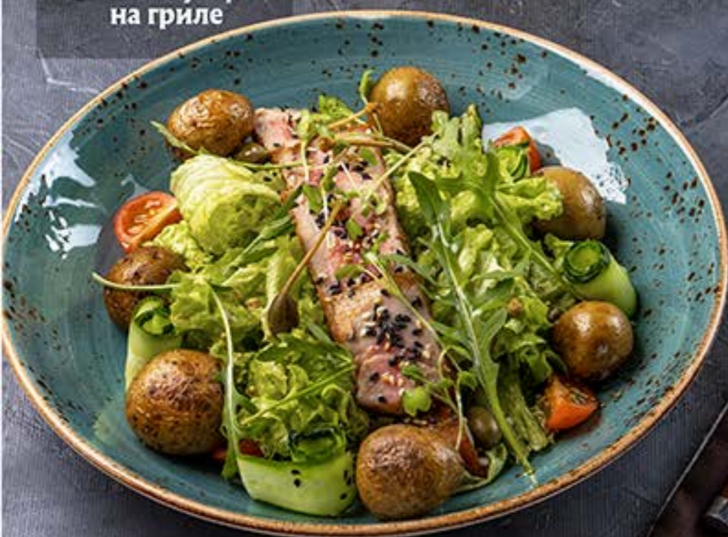
Салат с Тунцом на гриле