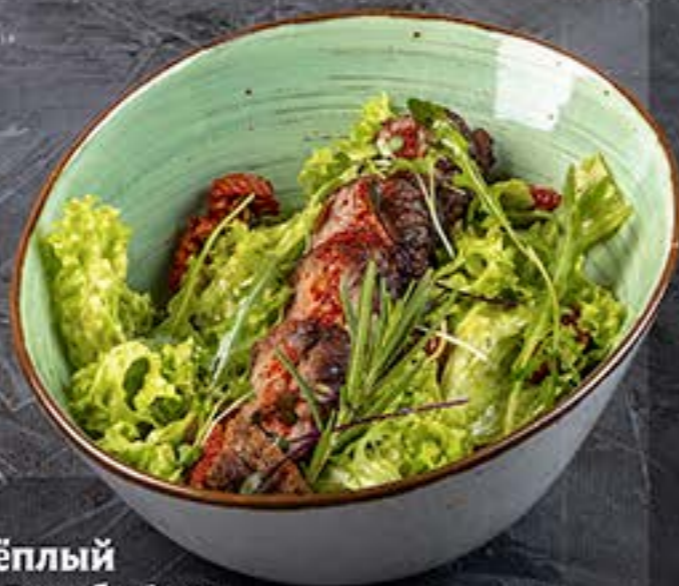
Тёплый салат с Ростбифом